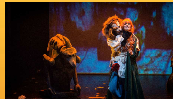
Beauty and the beast

Cette année, la compagnie présente « The Golden Compass » (théâtre en anglais), « La reine des neiges » et « Don Gil de las Calzas Verdes » (théâtre de l'Âge d'or espagnol).