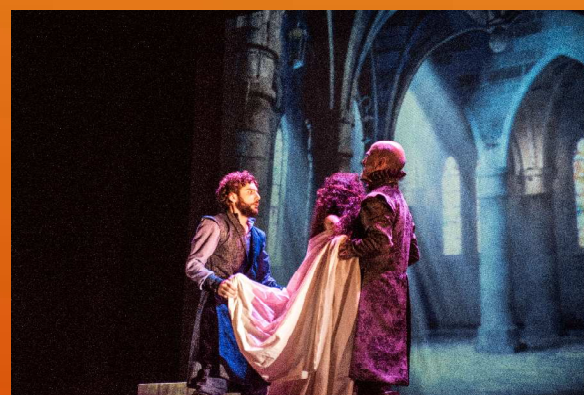
El castigo sin venganza