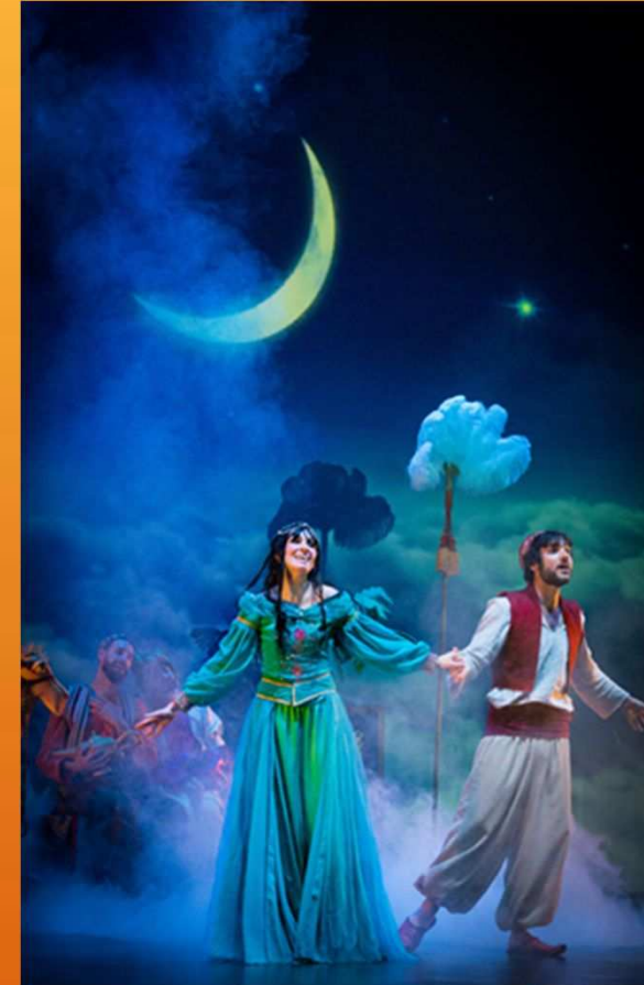
Aladdin and the Wonderful lamp

L'utilisation d'images et la technique de la cartographie vidéo sont également l'une des caractéristiques de cette compagnie de théâtre.