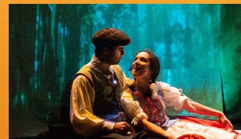
Hansel et Gretel